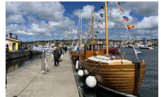
Evenemangsbryggan i Marstrand.

måndag fungerar detta också. Sophantering, el, dusch och toalett ingår.