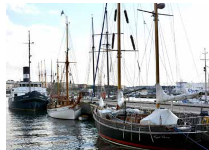
Ett par mindre skutor för om f.d. bogserbåten Stjärnö.