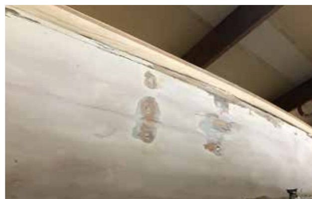
Pluggning och sprängning av gamla hålen för nitarna till röstjärnen.