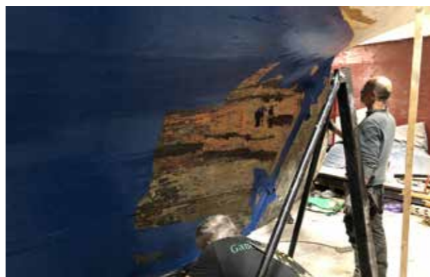
Bottenstrykning. Vi skippade primern eftersom bottenborden skall bytas efterhand.