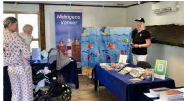
I hallen huserade bla Nidingens vänner.