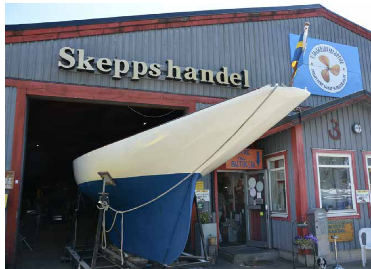
Gandul på väg ut ur hallen med flaggan satt för att möta havet.