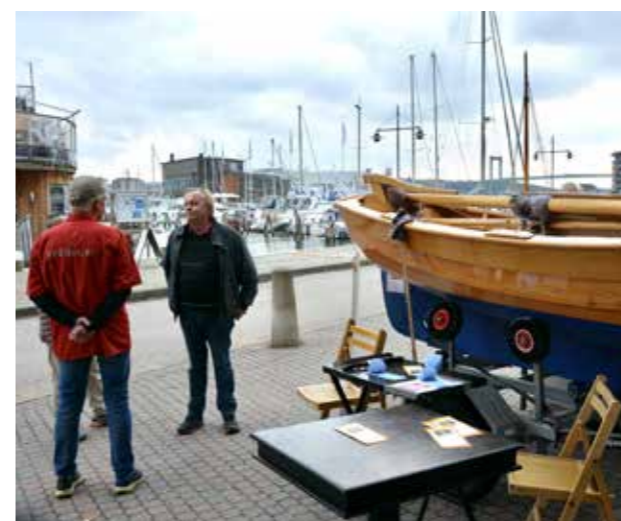
Försäljning av lotter på vår lotteka placerad på kajen vid Feskar Brettas Krog.

I år planerar man att ett stort antal skutor och andra traditionsfartyg skall delta. På kajerna kommer det att bli mycket aktivitet med repslageri, Claessons Trätjärna, irländsk musik, grillar på kajerna med ostron och andra godsaker, Maritim i Väst, Varvshistoriska föreningen och många fler. Många matställen har öppet vid kajerna. Färjan 4 kör turer mellan Klippan och Eriksberg.