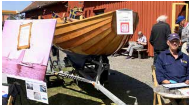
Ekan på bästa platsen. Informerade även om Gandul, dess historia och kursen i träbåtsreparation.