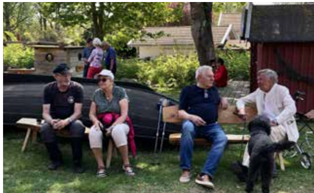
Fika och social samvaro.