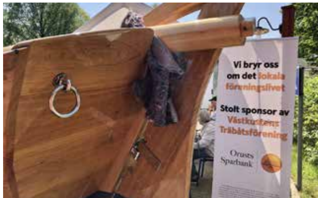
Vår sponsor från Orust ville också synas.