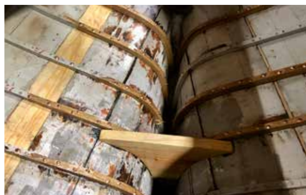
De nya spanten och bottenstocken.