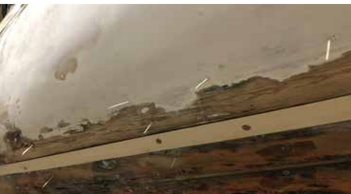
Bordläggning med ett spruns, till en nåtlimning med ett extra spruns.