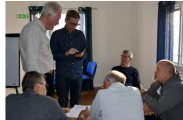
Nya styrelsen konstituerar sig (arkivbild).