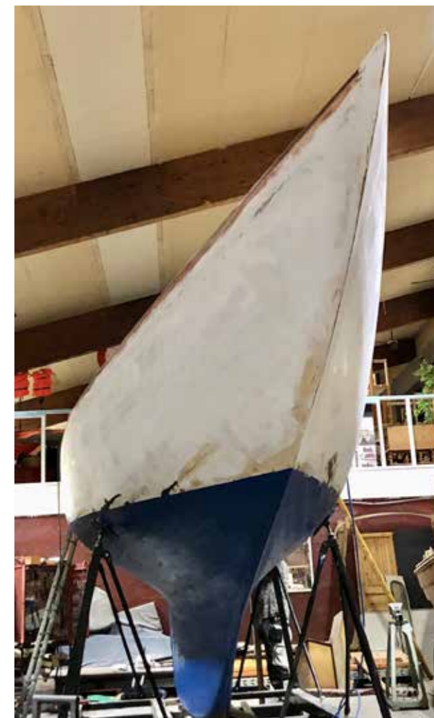
Ett sååå vackert skrov.