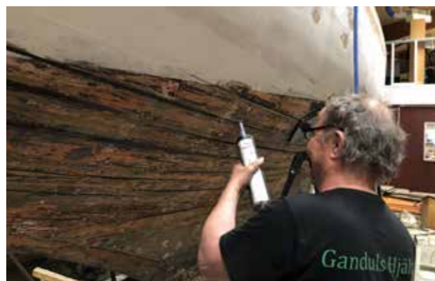
Bengt i färd med tätning.