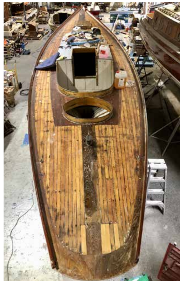
Det "nya" däcket av fin oregon pine fint konat.