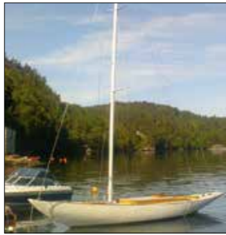
Man kan inte påstå något annat än att dessa linjer är ut-sökta.