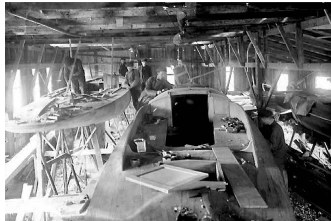
Mobergs Varv vid Färjenäs.