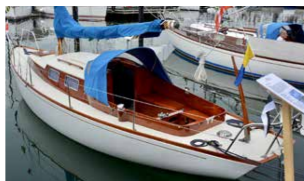
P28 Patricia som renoverats till nyskick.