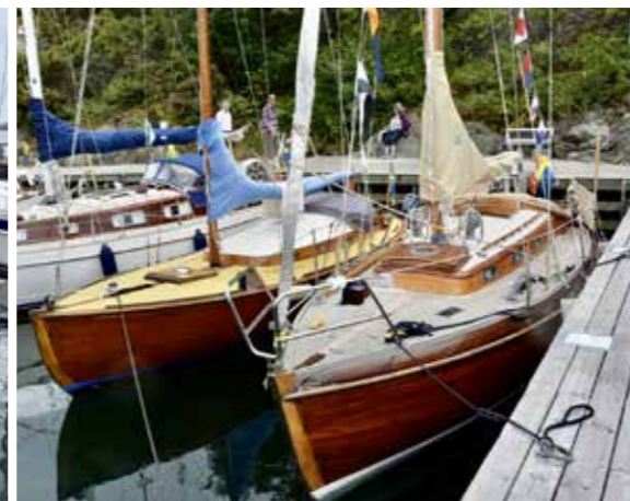
Levina och Katinka II. Bakom Katinka II skyms en Vindö 22 som sålts tre gånger och där pengarna, från varje försäljning sammanlagt 160 000, skänkts oavkortat till nödställda från Ukraina. Läs hela historien i nr 6 av På Kryss.