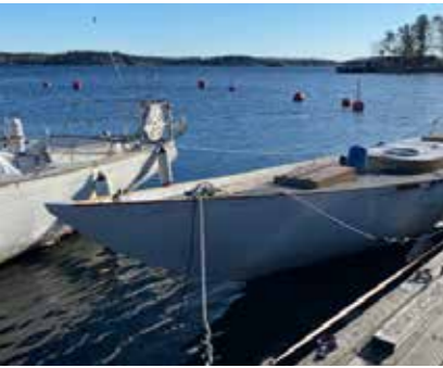
En skam att en av Sveriges äldsta seglande yachter bara lämnats vind för våg.