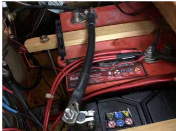
Det rosa värmebatteriet med specialmått.

Vi kopplade med stor försiktighet och skyddsglasögon bort förbrukningsbatteriet, tog ett glas vin i fotogenlampans sken och beslöt att gå hem dagen efter.