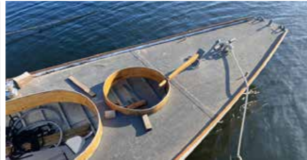
S/Y Gandul återställdes till ursprungligt utseende. En överbyggnad, sittbrunn och separatorbrunn precis som den såg ut när den lämnades över till KSSS maj 1895.