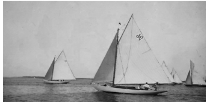
Fantastiska bilder tagna 1896 av Hjalmar Richnau. Här syns S/Y Gandul med nr 26 i storseglet. En svensk kulturskatt som du nu kan hjälpa till att rädda. De övriga båtarna på bilden är 19. Oriella, 22. Gerd, 28. Rower, 23. Lorelei.