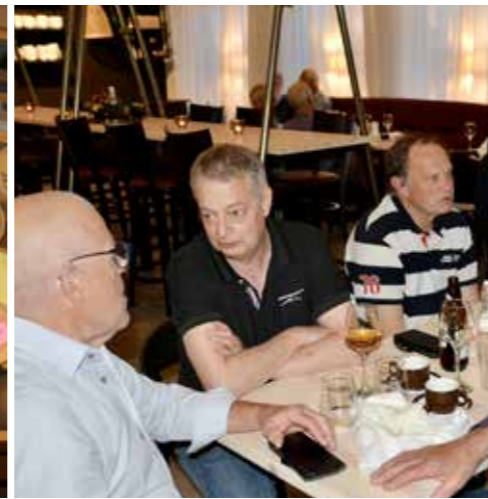
Tjöt efter middagen