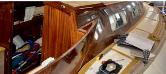
En Vindö 40 som får en ansiktslyftning.