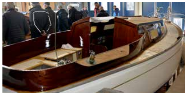
En Vindö 32 också under uppfräschning.