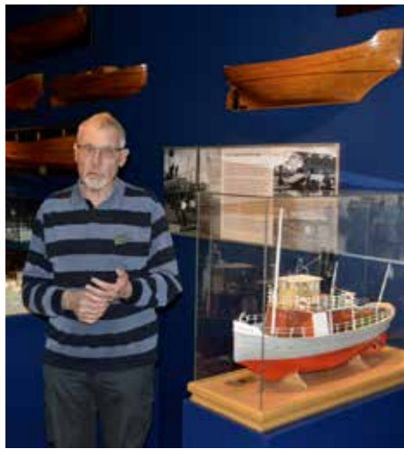
Vår duktige guide vid modellen av Sjöfartsföreningens bogserbåt "Nalle"