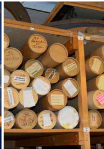
Ritningar i rullar och draglådor