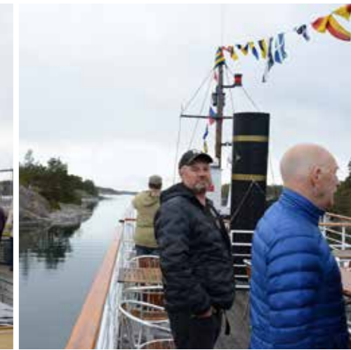
Ellen stävar fram genom en del trånga passager