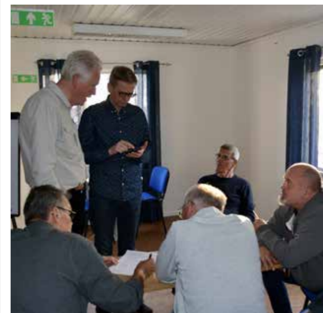
Nya styrelsen konstituerar sig.

Det nya stadgeförslaget lästes för andra gången och antogs. På hemsidan finns definitioner av