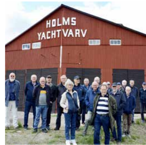
Hela gänget framför Gamleby Yachtvarv/Tore Holms Yachtvarv