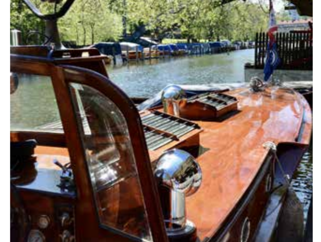
Fina detaljer på Loris.