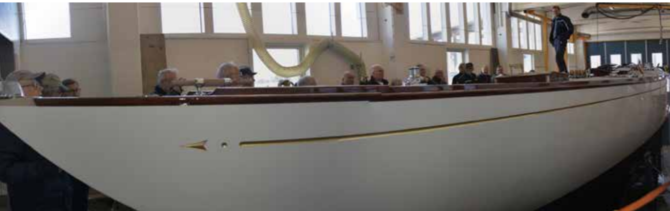
Wema III, pampigt skrov som utnyttjar maxlängden av hallen

Några av de största båtarna är 12 m R-jakter. Fn 2 st, Norska Wema III och den klassiska R12:an och Americas Cup båten Northern Light från 1938, designad av Olin J. Stephens, som nu seglar med svensk flagg. Northern Light har Vindö Marin renoverat och rustat upp. Northern Light har sin bas i Marstrand och kommer att seglas på kusten.