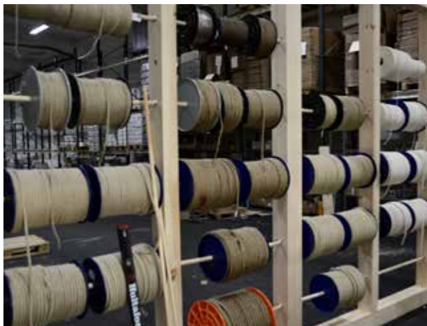
Tågvirke, 3-slagen hampa och 3-slaget manilarep.