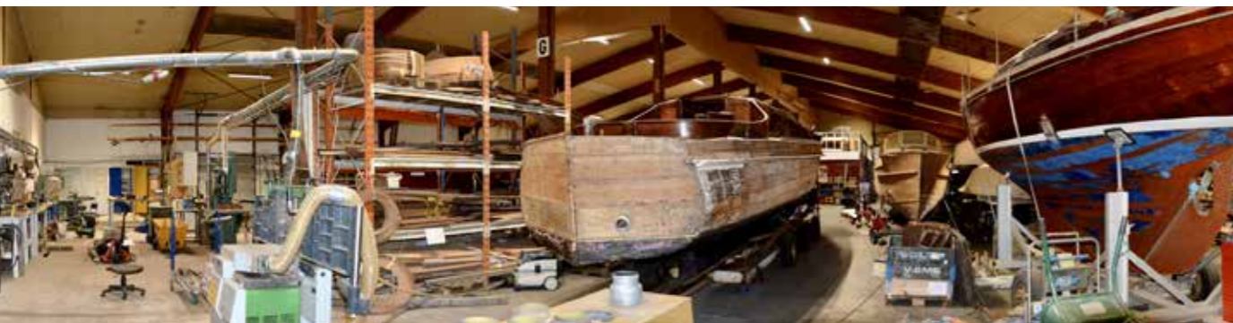
Hallen, vy över renoveringshallen. I bakgrunden syns loftet över kontorsdelen som kommer att bli sömnadsloft.