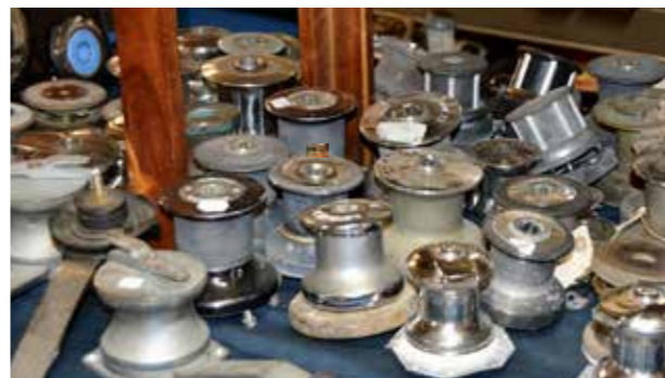
Vinschar, alla storlekar!