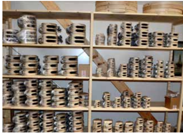
Träblock och mastringar i olika storlekar.