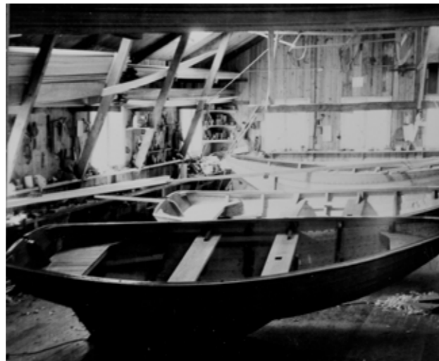
Pappa Halvard och Willys verkstad/varv där de seriebyggde 200 GKSS-ekor.