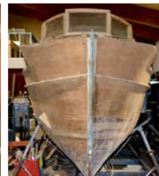
Ruter Damen, Klassisk CG Pettersson räddad åt eftervärlden.