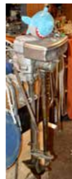
En del rariteter finns också.