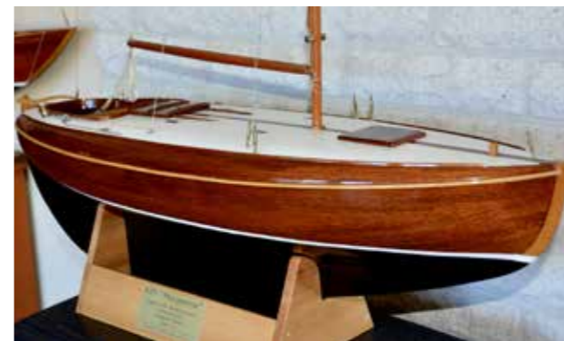
K 25 Marguerite.