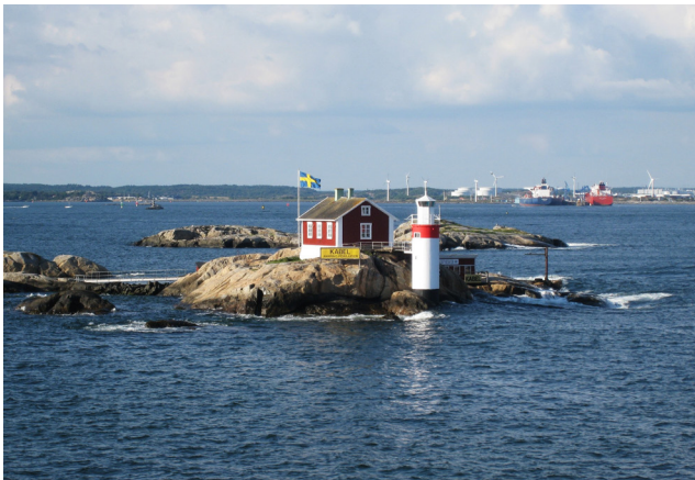
Gäveskär vid södra farleden in till Göteborgs hamn.