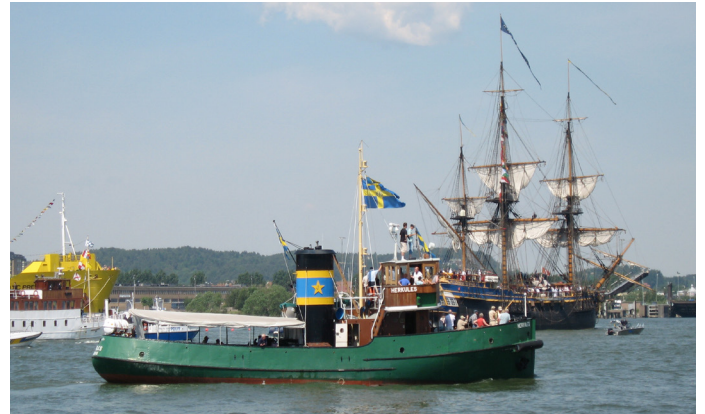
Herkules välkomnar Ostindiefararen Göteborg efter återkomsten från Kina 2007.

Sedan Herkules levererades från varv 1939 har hon haft sin verksamhet i Göteborgs hamn. Herkules är unik för att hon aldrig byggts om eller bytt motor och ser idag i stort sett ut som hon gjorde vid leveransen 1939. Hon byggdes i en brytningstid mellan ång- och motordrift. En motor installerades men exteriört ser hon ut som en ångbogserare med sin höga skorsten. Hon utrustades med KaMeWa-propeller. Den 3:e propellern som byggdes och den är idag den äldsta ställbara propeller i drift.